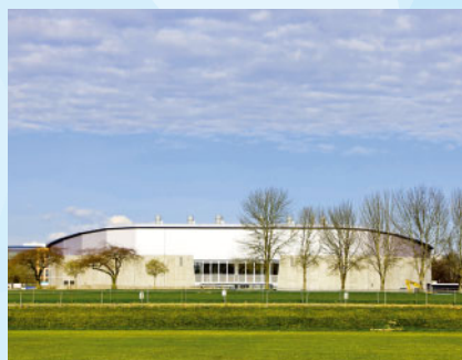
UBC Thunderbird Arena