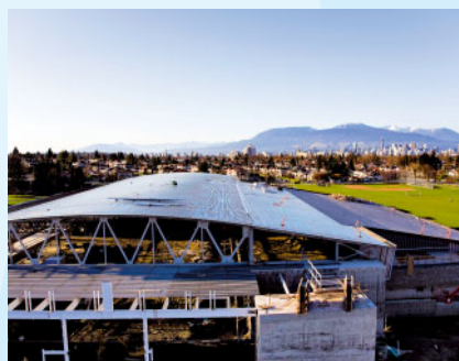
Vancouver Olympic Centre