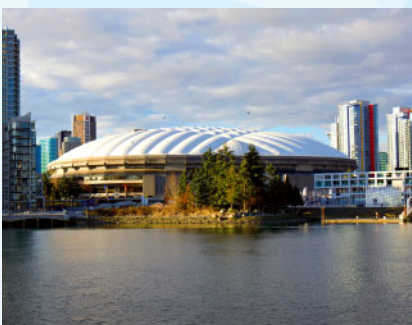
BC Place Stadium