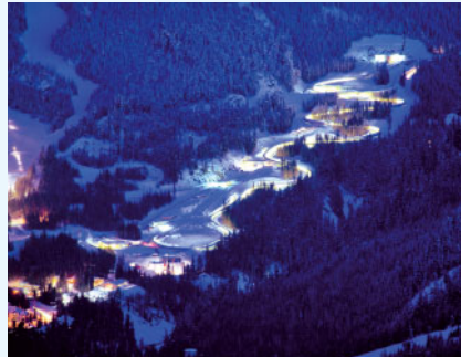
Whistler Sliding Centre