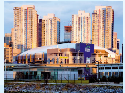
Canada Hockey Place